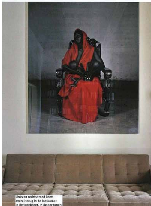
Links en rechts: rood komt overal terug in de leeskamer. In de tegelvloer, in de gordijnen, in de Black Madonna with Twins van Vanessa Beecroft, en in het portret van Kate Moss.

leuk om een link te leggen tussen het kunstwerk en de ruimte waar het kwam te hangen. Zo heeft het rood uit de Black Madonna with Twins van Vanessa Beecroft me ertoe gebracht om voor rode gordijnen te kiezen. Waar ik het meest trots op ben? Op de keuken. Het is een eigen ontwerp, uitgevoerd door Varenna. Een strakke keuken, in roestvrij staal. Een mooi contrast met de oude tegels op de vloer.'